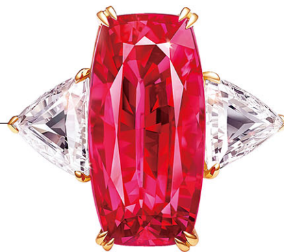
ASTER MA 高级珠宝定制传藏系列马亨盖尖晶石钻石戒指。