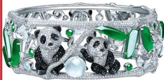
高级珠宝定制自然恩赐系列熊猫手环 Aster Ma 价格店洽