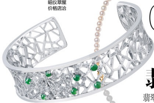
Minigem 系列 18K 金镶嵌绿色翡翠及钻石手镯 昭仪翠屋 价格店洽