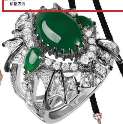
Dily's 高级定制系列白金镶翡翠钻石戒指 sulikeit 高级珠宝 价格店洽