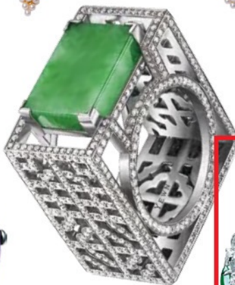
窗花纹系列 18K 白金翡翠 及钻石如意戒指 Ywen 价格店洽