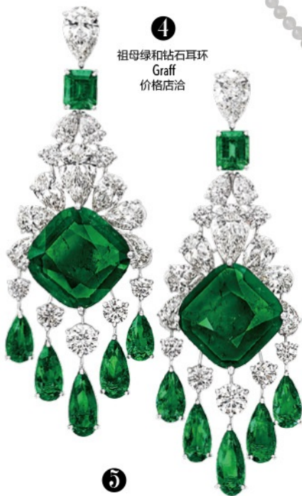
祖母绿和钻石耳环 Graff 价格店洽