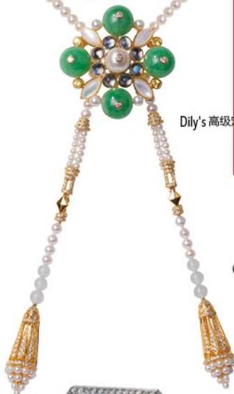
牡丹高级珠宝 “玲珑”宝裕和翡翠会 价格店洽