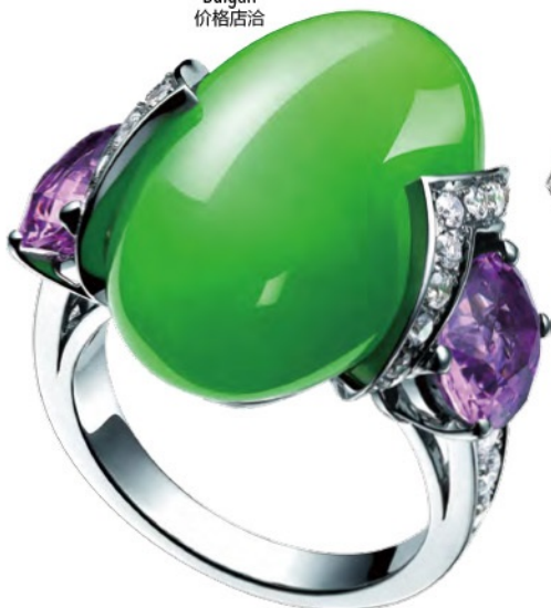
顶级珠宝系列 18K 金镶翡翠 及彩色尖晶石戒指 Bulgari 价格店洽